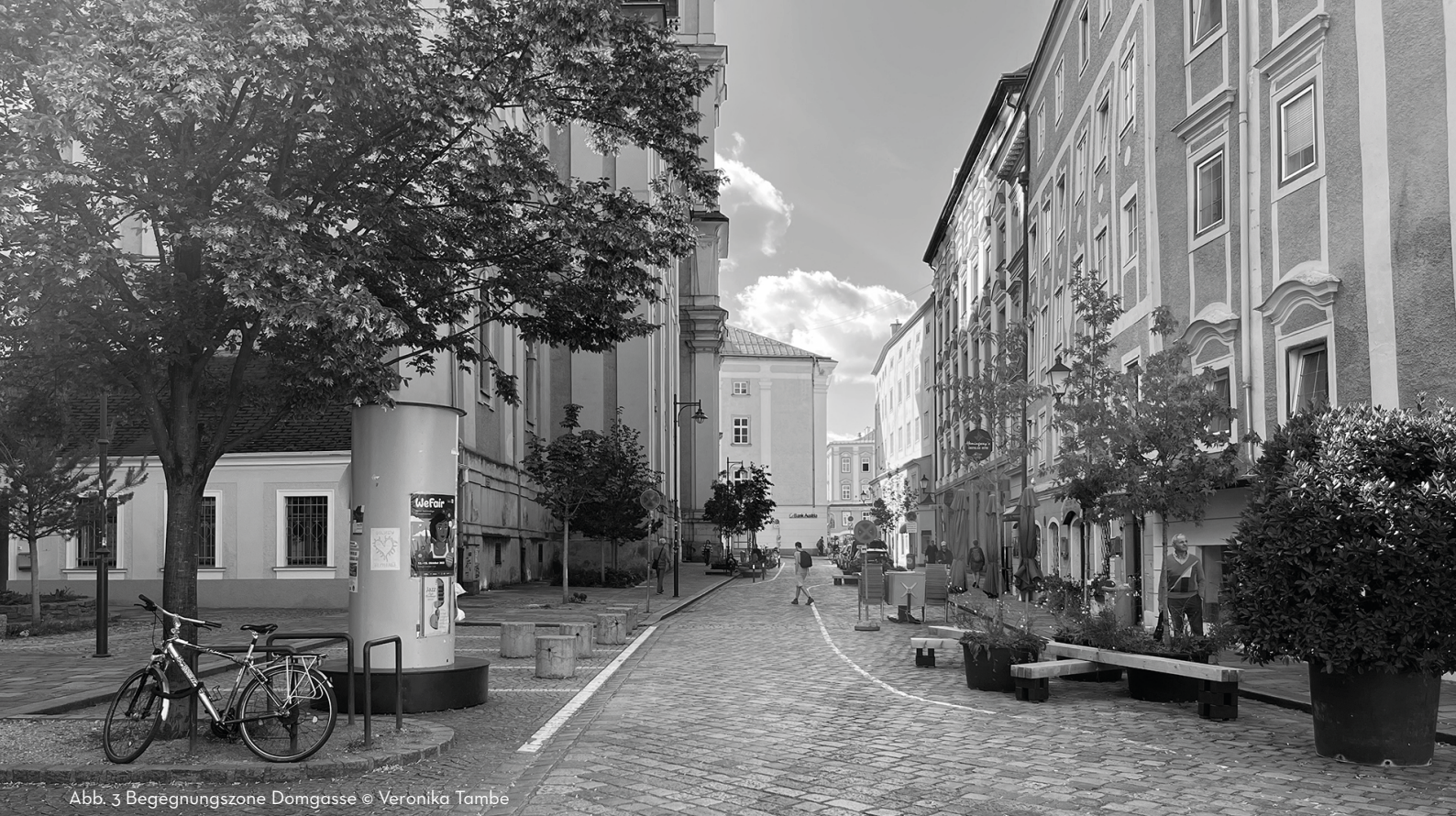
Abb. 3 Begegnungszone Domgasse

Unter dem Motto „Frauen bauen Linz“ soll Gender Planning im Magistrat Linz zukünftig eine größere Bedeutung erhalten als bisher; derzeit liegt der Frauenanteil in der Linzer Stadtplanung bei 25 Prozent. Inspiriert durch die Wanderausstellung Frauen Bauen Stadt und das Symposium Stadt fair gestalten erfolgte im Frühjahr 2024 ein Gemeinderatsantrag aller Stadtseparationsfraktionen zur verbesserten Berücksichtigung von spezifischen Bedürfnissen von Frauen in Stadtgestaltung und Stadtplanung. Nach einstimmigem Beschluss erfolgt nun eine abteilungsübergreifende Behandlung im Linzer Magistrat. Mittels Erhebung der Bedürfnisse und Wünsche der Linzerinnen werden Handlungsempfehlungen für einzelne Abteilungen entwickelt, um eine allgemeine Verbesserung