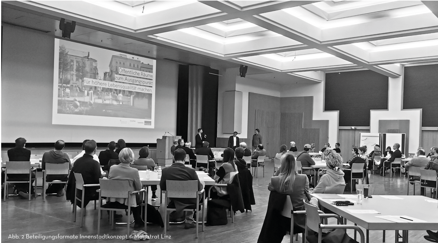
Abb. 2 Beteiligungsformate Innenstadtkonzept

derungen im Wohnbau, in Quartieren, im Städtebau und in der Raumplanung. (Jochimsen & Knobloch, 1997)