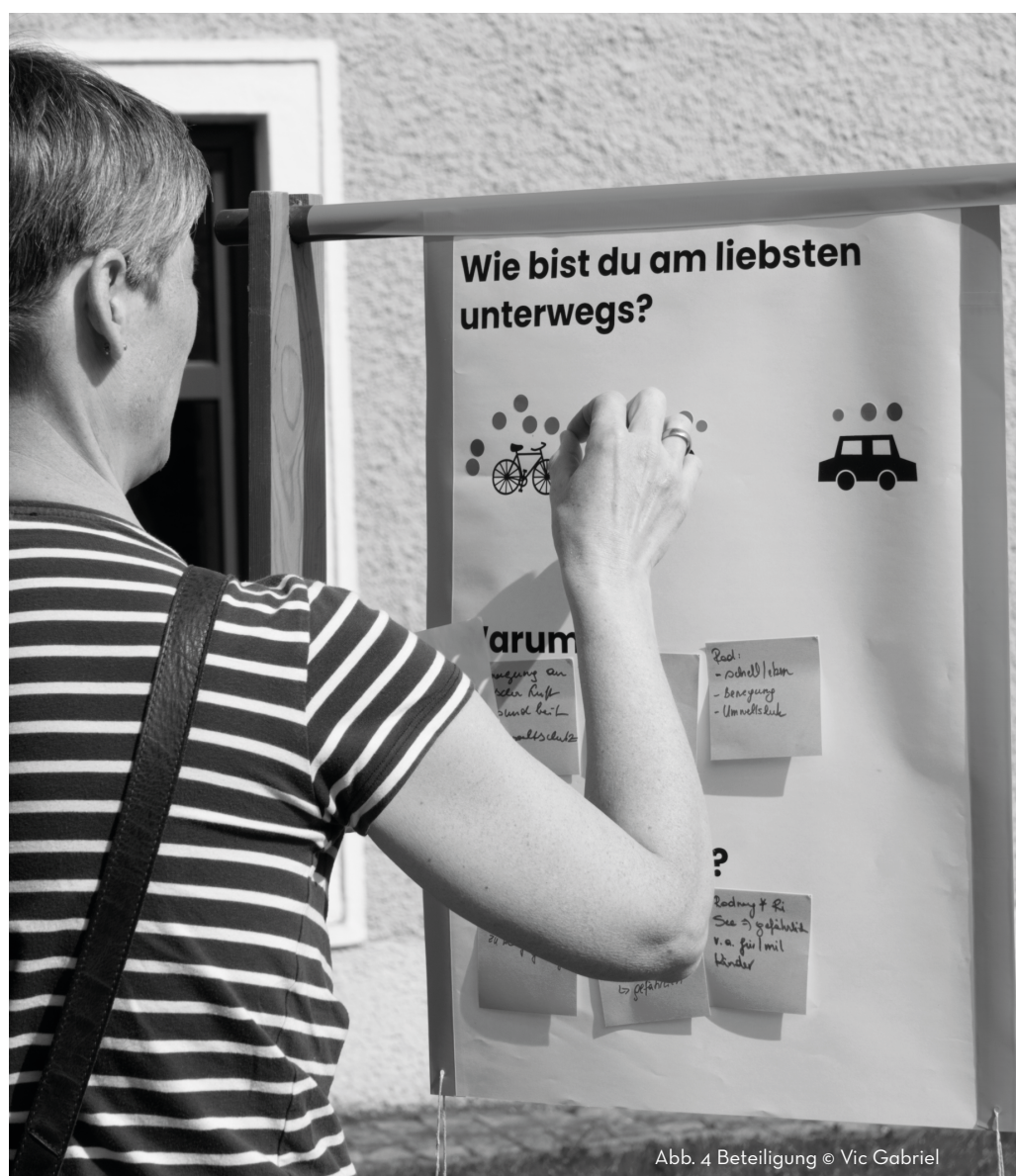
Abb. 4 Beteiligung

nutzen nur 17 Prozent diese Daten auch tatsächlich. Zudem sind Frauen in Entwicklungs- und Entscheidungsteams unterrepräsentiert, daher überwiegt die männliche Perspektive auf Daten und Entwicklung (Point & FFG, 2024). Am Beispiel Car-Sharing kann dies veranschaulicht werden: da nur 20 Prozent der Nutzer*innen Frauen sind (Singer et al., 2021), wird das Angebot auf Basis der überwiegenden Daten weiterentwickelt,