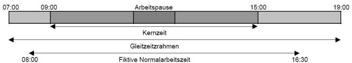
Abbildung 1: Übersicht Gleitzeit 145

Allgemein wird die Gleitzeit in eine echte und in eine variable Gleitzeit unterteilt. Die echte Gleitzeit hat den Vorteil, dass der DG eine Kernarbeitszeit vorgibt und der DN diese einhalten muss. Die Dauer und die Lage der Kernzeit muss festgelegt werden und sie besagt, dass zu dieser Zeit der Mitarbeiter an seinem Arbeitsplatz anwesend sein muss. Somit hat der DG einen gewissen Zeitrahmen, bei dem er weiß wann sein Angestellter zumindest da sein muss. Die Zeit außerhalb jener Kernzone ist frei einteilbar und ist der eigentliche Gleitzeitrahmen. Im variablen Gleitzeitsystem gibt es diese Kernzeit nicht. 144