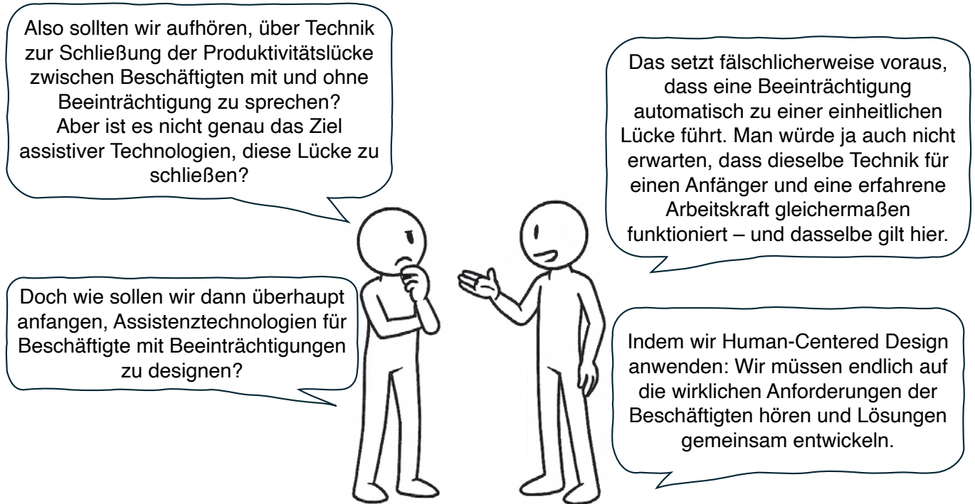
Bild 1: Unsere Vision – zukünftige Assistenzsysteme für Beschäftigte mit Beeinträchtigungen, bei denen die industrielle Forschung die Mitarbeitenden von Anfang an in den Entwicklungsprozess einbezieht (die Comicfiguren wurden mit KI generiert).

eingeschränkter Arbeitsfähigkeit und geringerer Produktivität. Vor diesem Hintergrund starteten wir 2023 das Forschungsprojekt A2I, das den Einsatz von Augmented Reality (AR) als Lernassistententool in einer geschützten Werkstatt untersucht. In den vergangenen zwei Jahren haben wir den Human-Centered-Design-Ansatz verfolgt und eng mit Menschen mit Beeinträchtigungen zusammengearbeitet. Unsere Erkenntnisse stellen die gängige Sichtweise der industriellen Forschung infrage, insbesondere die Vorstellung, dass Assistenztechnologien als „Enabling Tools“ für die industrielle Arbeit dienen. Anhand autoethnographischer Einblicke reflektieren wir kritisch über die Rolle von Forschung bei der Entwicklung und Förderung digitaler Assistenzsystemen in zukünftigen Studien.