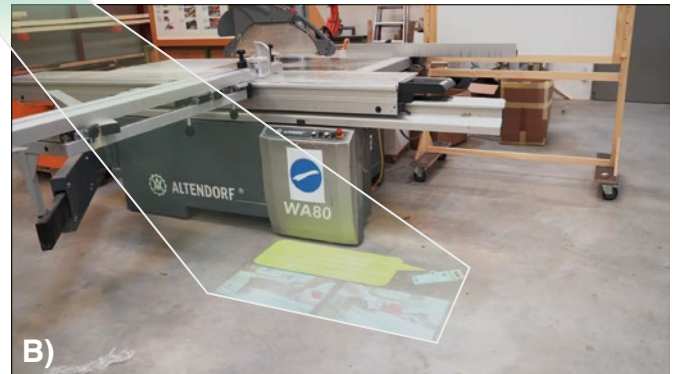
Bild 2: Darstellung ausgewählter Use Cases: A.) Erlernen der Programmierung eines kollaborativen Roboters mit SAR-Anweisungen; B.) Lernvideos integriert direkt im Arbeitsbereich am Beispiel der Bedienung einer industriellen Kreissäge; C.) Interaktive Projektionen, dargestellt am Beispiel der Auswahl des richtigen Sägeblatts passend zu konkreten Materialeigenschaften.

tenztechnologien als Hilfsmittel zur Steigerung der Produktivität und Verbesserung der Arbeitsfähigkeit basiert meist auf kurzfristigen Studien, die unter Laborbedingungen durchgeführt wurden. Es besteht jedoch weiterer Forschungsbedarf hinsichtlich der langfristigen Perspektiven von Assistenzsystemen für Arbeitnehmer mit Beeinträchtigungen. Wir möchten diese Lücke durch langfristige Überlegungen und Reflexionen zum Einsatz von SAR in einer geschützten Werkstatt schließen.